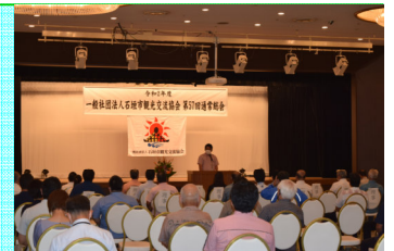
令和2年度 第57回通常総会