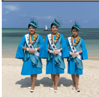
第42代ミス八重山 (写真中央から)