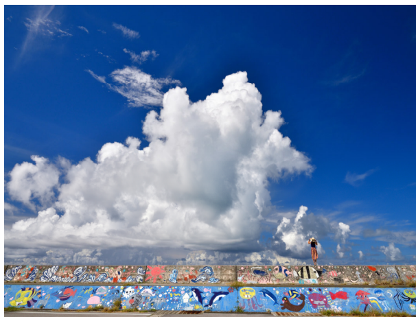
✿ 青年部長賞「子供達の想い」

応募頂いた作品の中から、本会役員による審査や本会FaceBook投稿による、いいね数を参考にし、選出致しました。