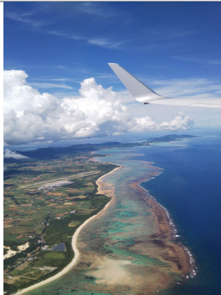
✿ ベストオブ石垣島賞「飛行機から見た真夏の石垣島」