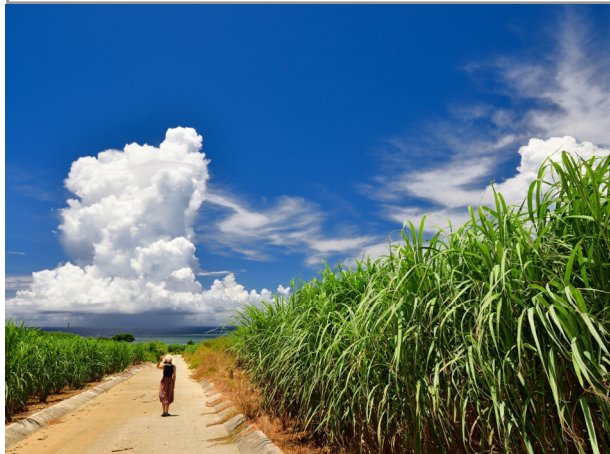
✿ ベストオブいいね賞「島の宝物」