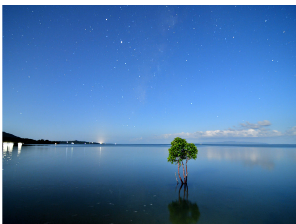
✿ 会長賞「名蔵湾の一本のヒルギ」