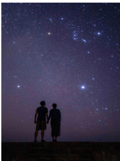
✿ いつの世までも賞「星に願いを」